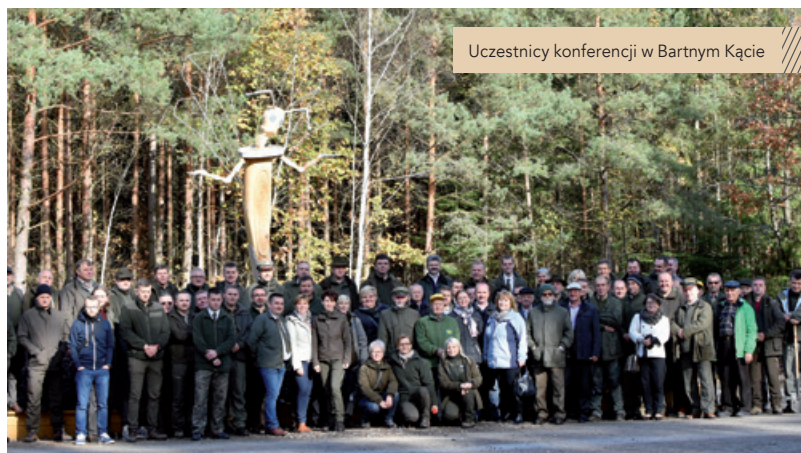
Uczestnicy konferencji w Bartnym Kącie