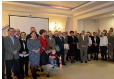
Uczestnicy wieczoru autorskiego

Autor odpowiedział na wiele pytań, a także odkrył tajniki swojej pasji. – Zainteresowanie historią leśną rozpoczęło się u mnie 20 lat temu, kiedy przegląda-