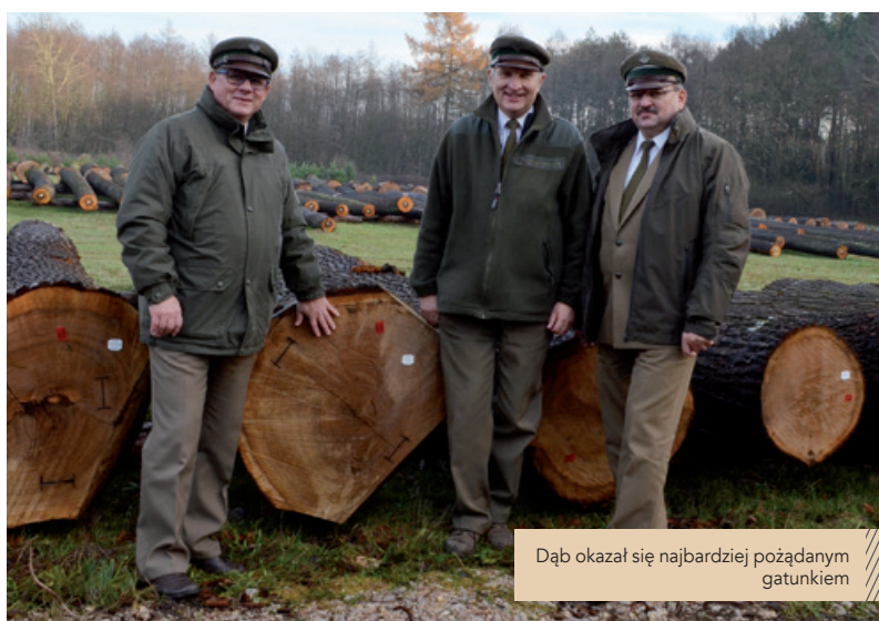
Dąb okazał się najbardziej pożądanym gatunkiem

cja w kierunku wyselekcjonowanego dębu, który jest poszukiwany przez nabywców. Kolejne spostrzeżenie dotyczy potwierdzenia marki przez