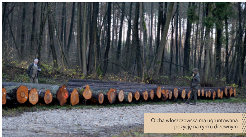
Olcha włoszczowska ma ugruntowaną pozycję na rynku drzewnym

Średnia cena sprzedaży wszystkich gatunków była wyższa niż uzyskana w trakcie pierwszej i drugiej regionalnej submisji i wyniosła 1 730 zł za m sześć. Doświadczenia z submisji są pozytywne – leśników cieszy to, że potrafią wyhodować i przygotować drewno o ponadprzeciętnych cechach użytkowych docenianych przez producentów z branży drzewnej. Tym bardziej że jest to produkt ekologiczny i odnawialny powstający z poszanowaniem zasad zrównoważonego rozwoju i przepisów prawa, co potwierdzają certyfikaty FSC® i PEFC. Drewno to budzi zainteresowanie nie tylko odbiorców, ale i leśników – jest to doskonała sposobność do szkoleń brakarzy. Tym samym RDLP w Radomiu potwierdziła swoje miejsce w kalendarium submisji w LP. Warto podkreślić w tegorocznej submisji jest to, że dobrym kierunkiem jest specjaliza-